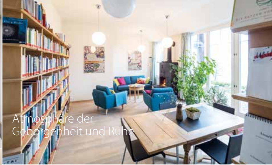
Atmosphäre der Geborgenheit und Ruhe