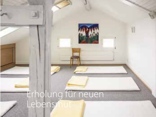
Erholung für neuen Lebensmut