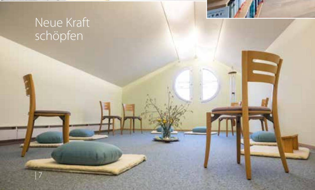
Neue Kraft schöpfen